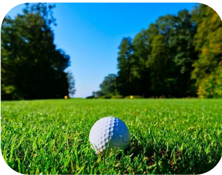
Campos de Golf