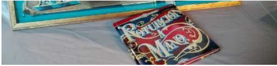
El premio al emprendimiento ha ido a parar a la empresa madrileña de Rotulación a Mano.

http://www.efeestilo.com/noticia/premio-nacional-artesanía/