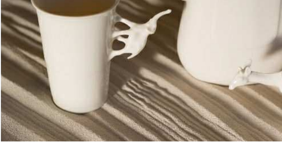
Diseño de Yukiko Kitahara.

http://www.efeestilo.com/noticia/premio-nacional-artesania/