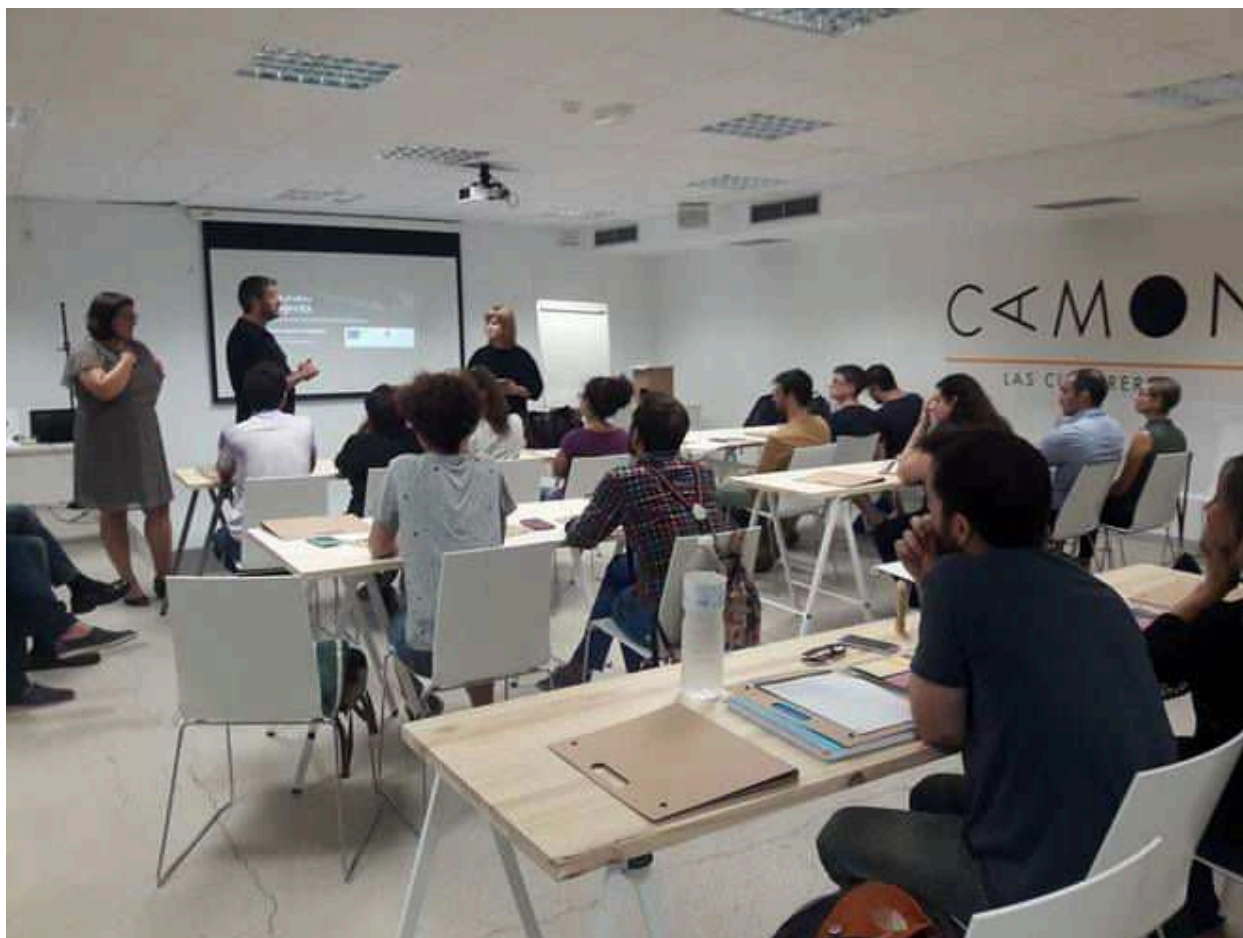
Las actividades se llevan a cabo en el aula CAMON de Las Cigarreras ELMUNDO

ImpulsaCultura Projecta inicia su andadura para profesionalizar al sector creativo y cultural de Alicante