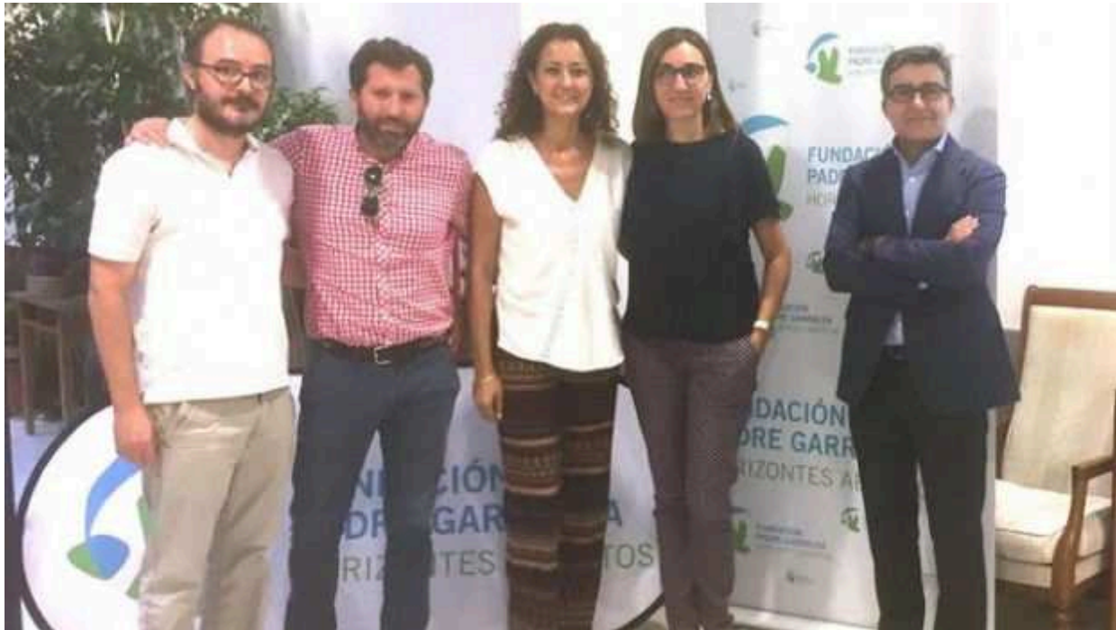
Acuerdo Fundación Padre Garralda - Horizontes Abiertos, EOI y Orange