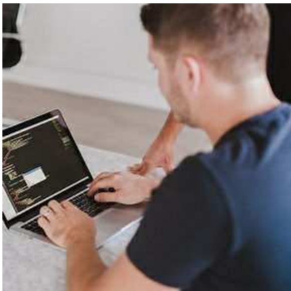
imagen de la noticia

Recursos Humanos RRHH Press. La Fundación Padre Garralda-Horizontes Abiertos , Orange España y la Fundación EOI ofrecerán formación gratuita en nuevas herramientas digitales a colectivos en exclusión social , como presos, drogodependientes o madres sin recursos, a través del programa de capacitación ciudadana 'Sé Digital'.