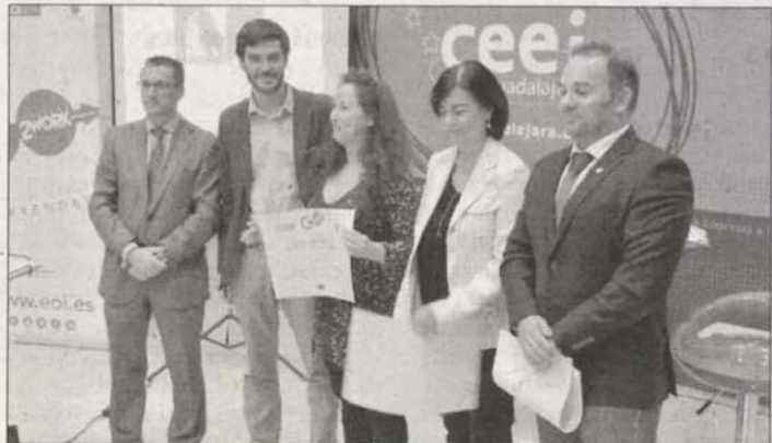
Los proyectos distinguidos: La Hispano, Irlanda Viajes y Manos con Corazón.