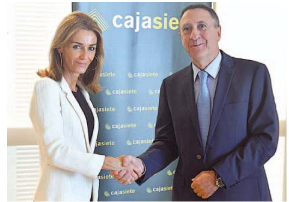
Firma de la colaboración entre la entidad y la escuela. | LOR

La EOI es la primera escuela de negocios fundada en España en 1955. En sus más de 62 años de historia han pasado por sus aulas más de 84.500 directivos y gestores empresariales especializados