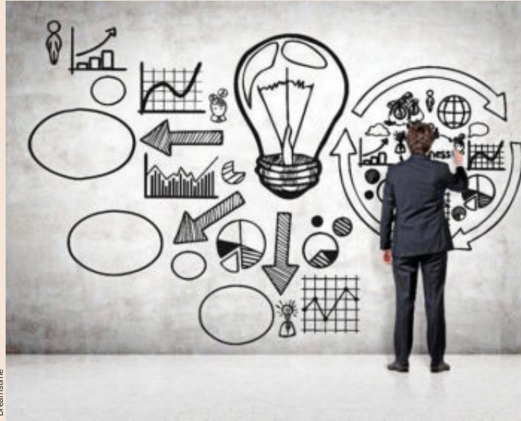
Una buena idea de negocio debe generar clientes y tener potencial de crecimiento.

Por otro lado, una vez determinado este perfil, hay que comprobar si la idea de negocio resuelve un problema real para el cliente. En este punto, es recomendable diseñar un Producto Mínimo Viable (MVP, por sus siglas en inglés) y probarlo con un grupo de clientes. Además, como explica Néstor Guerra, profes-