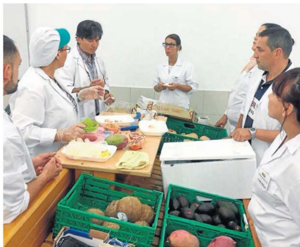
Un momento de los cursos de formación recibidos en la sede central de Gadis