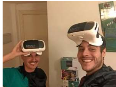
HeroMask de EducaInventions es el primer juguete basado en un videojuego para aprender idiomas en realidad virtual.