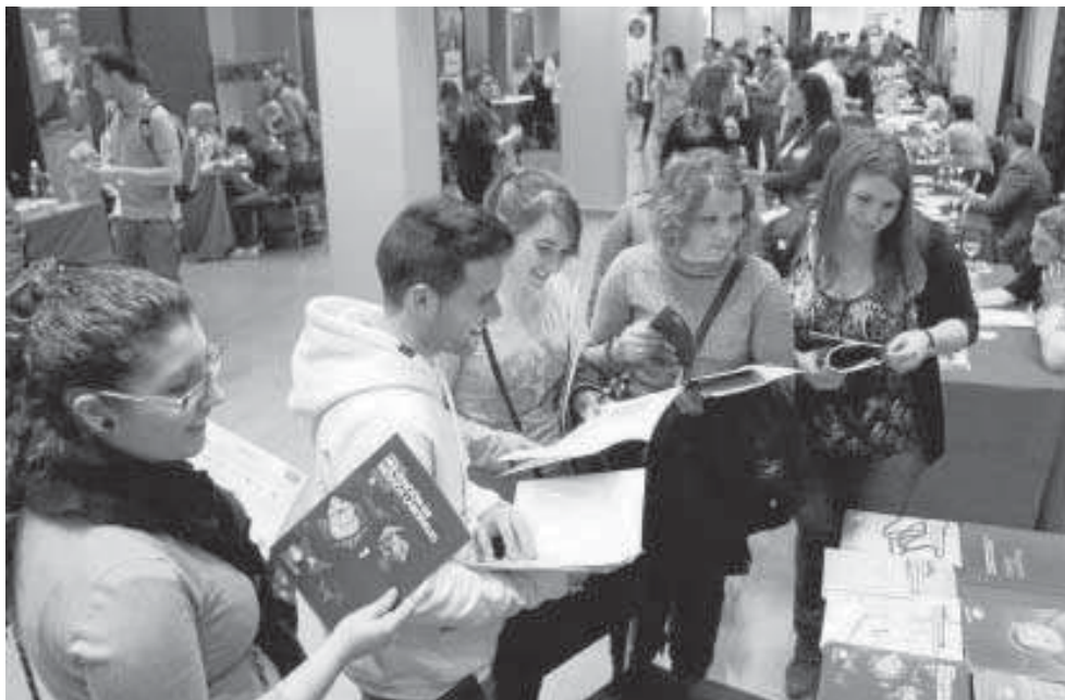
Varios jóvenes en una de las ediciones pasadas de la Feria Internacional de Estudios de Posgrado.