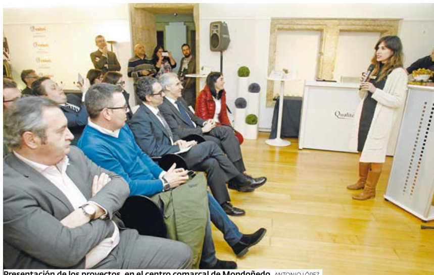
Presentación de los proyectos, en el centro comarcal de Mondoñedo. ANTONIO LÓPEZ

Otra de las iniciativas consiste es una inmobiliaria especializada en el mercado extranjero para vender viviendas en Mondoñedo para rehabilitar con todos los servicios incluidos. En esta línea también se encuentra un personal shopper inmobiliario, que prestará acompañamiento y asesoramiento a clientes extranjeros o nacionales