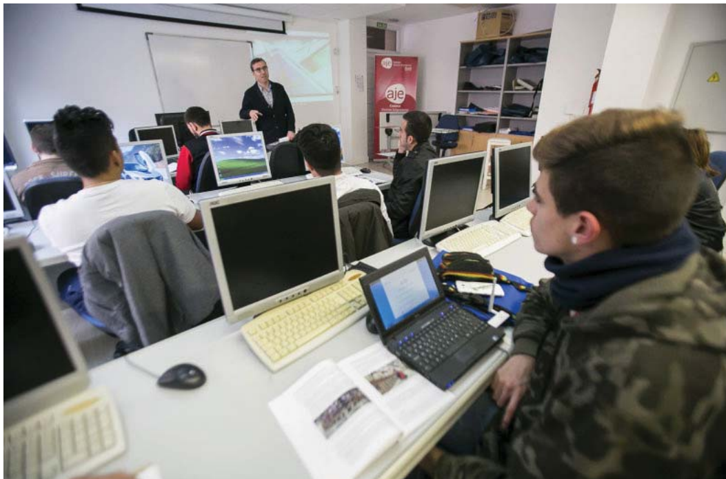
Varios jóvenes desempleados reciben un curso en el aula del vivero de AJE.

Y es que, según afirma, el vivero de empresas ha permitido que los emprendedores hayan apostado por permanecer en Cuenca y desarrollar sus nuevos proyectos aquí. De otra forma, se habrían marchado a otras ciudades españolas, caso de Madrid o