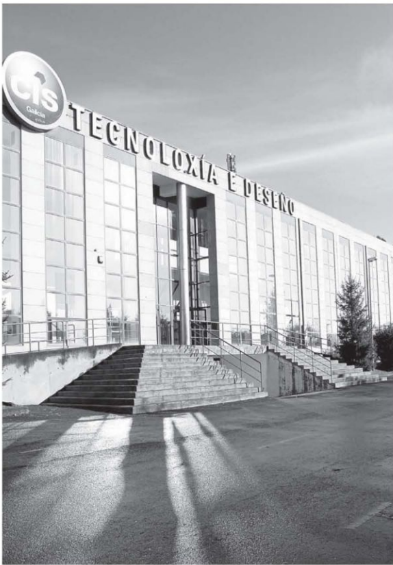
El CIS de A Cabana acoge durante varios meses los talleres y tutorías