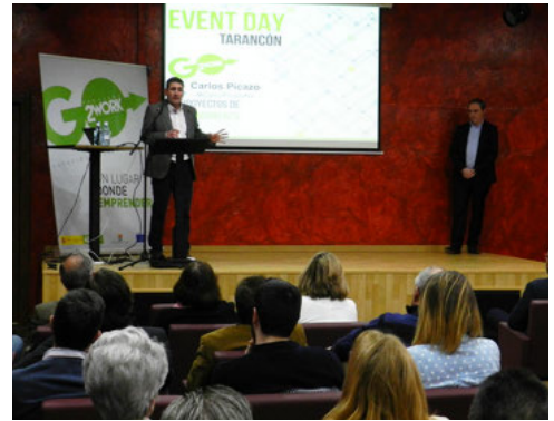
Más de medio centenar de empresarios y desempleados participan en Finca La Estacada en una jornada sobre emprendimiento enmarcada en el espacio 'coworking' creado en Tarancón.