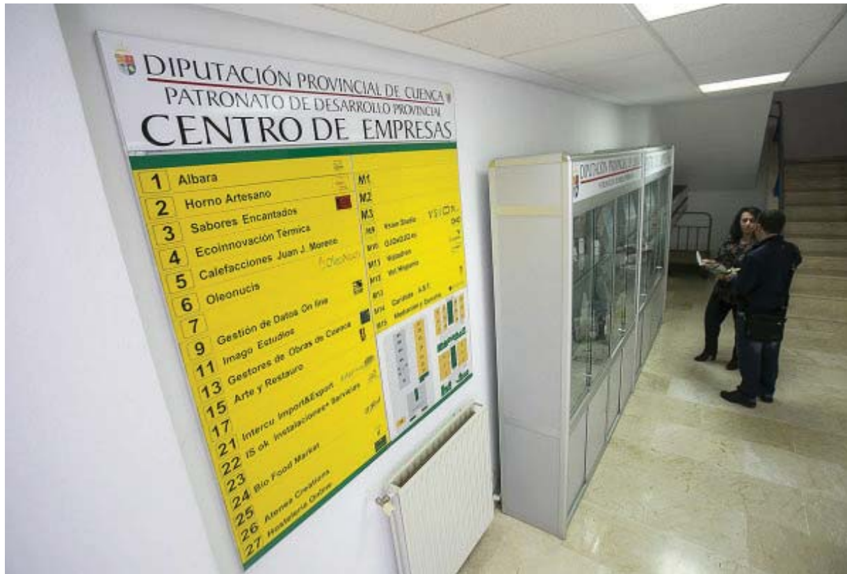
El centro de empresas tiene una ocupación actual del 80 por ciento. / REYES MARTÍNEZ

Nos interesa que los proyectos que se asientan aquí generen trabajo de calidad, un empleo que perdure, y esperamos que de esas ideas puedan surgir uno, dos o tres puestos», añade la presidenta del Patronato de Desarrollo, que considera que Cuenca «es una provincia con muchas recursos y posibilidades. La institución provincial está muy cerca de los emprendedores. Eso nos da una visión muy clara de cuales son sus necesidades».