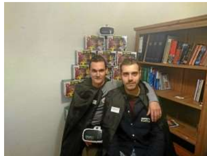
La empresa se constituyó finalmente tras una exitosa campaña crowdfunding, en diciembre de 2016.

El joven se inició en el aprendizaje de chino durante su beca Erasmus en la ciudad polaca de Breslavia donde, nos cuenta, realizó su primer videojuego.