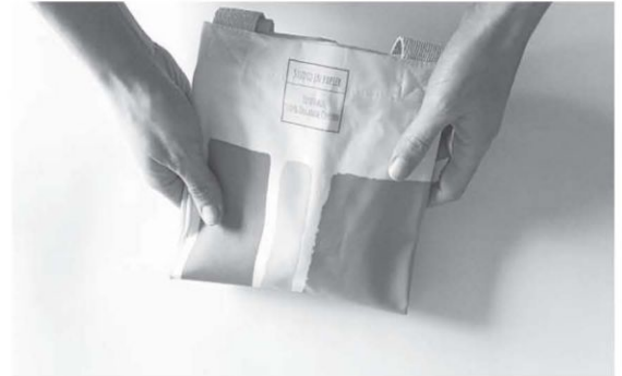
Algunos de los diseños de la ferrolana Irene Lustres, que ofrece en su tienda on line productos y complementos del día a día, desde pañuelos y fulars, hasta bolsos y neceseres o libros de notas