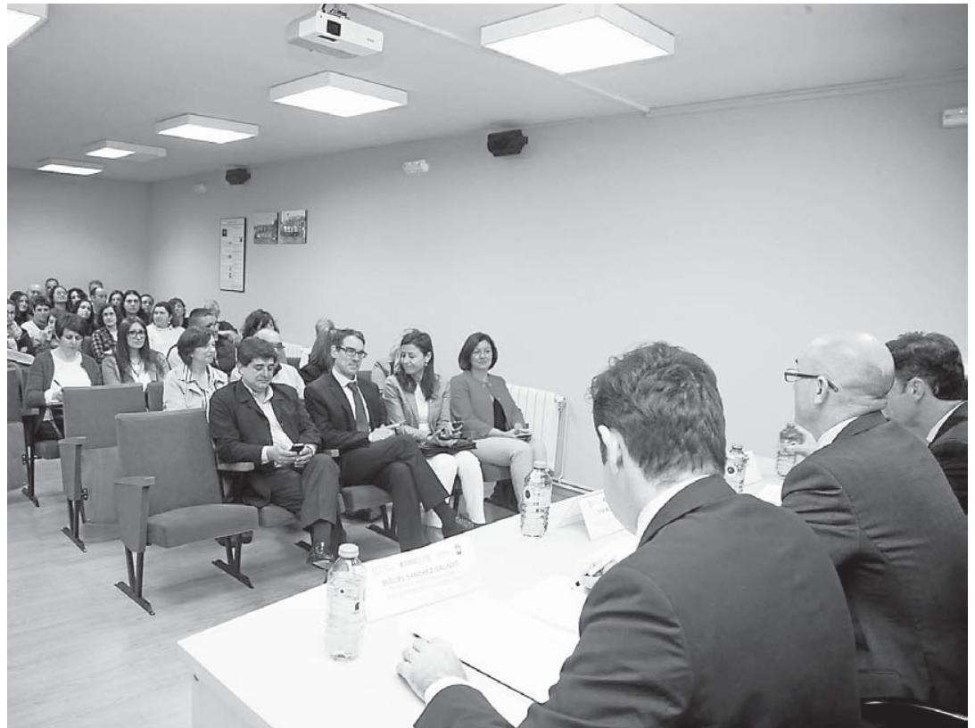
El coworking de Cabana se presentó el verano pasado

Los emprendedores seleccionados contaron con servicios de apoyo personalizados para desarrollar sus ideas de negocio y acelerar la puesta en marcha de sus empresas. Hasta el próximo