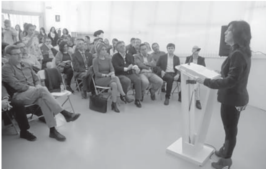
La consejera de Educación y Empleo, Esther Gutiérrez, en la presentación del plan en Mérida.

La puesta en marcha del plan dependerá de la aprobación y publicación de los decretos de convocatorias de los distintos programas, una normativa en la que aún se trabaja. La intención es que puedan empezar a aplicarse a lo largo de la primavera y el verano.