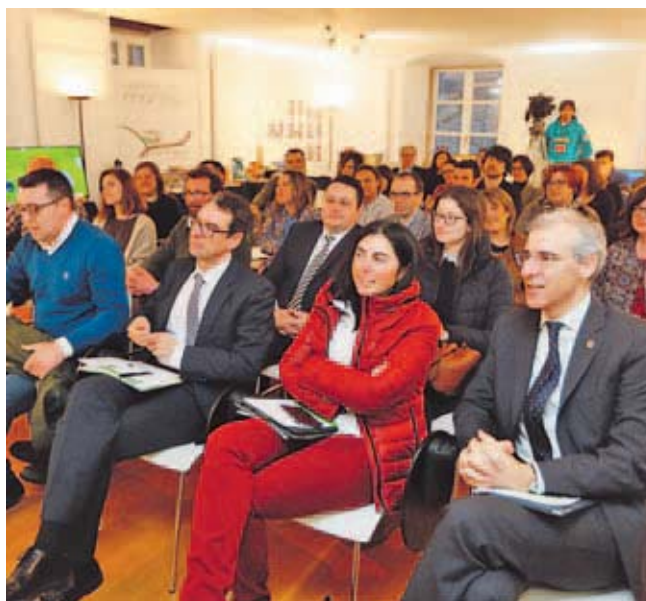
El titular de Industria clausuró la jornada en Mondoñedo. x. r.