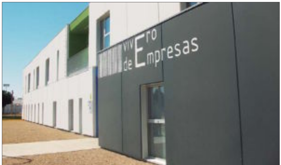
El Ayuntamiento estimula la iniciativa empresarial con el nuevo Vivero de Empresas

El Área de Promoción Económica del Ayuntamiento de Manzanares, subraya el incremento de empresas, por encima de la media provincial. Un dato que supone el 11% más de empresas creadas hasta el mes de junio, y un 5,5 % más que en el mismo