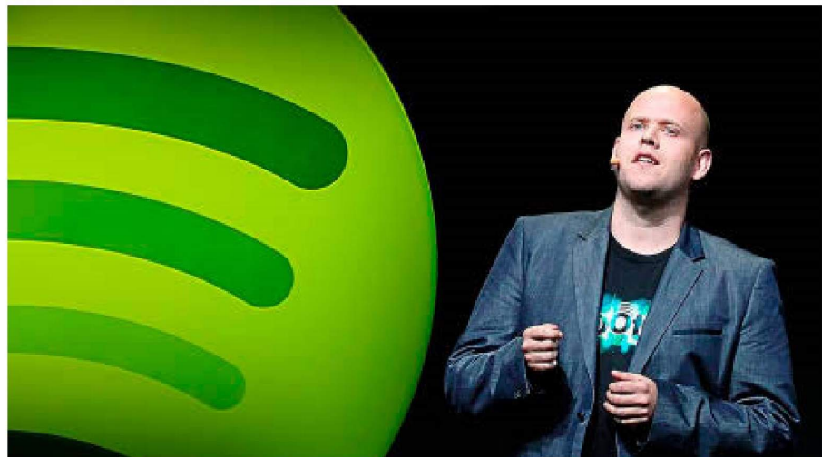
Spotify es la primera startup europea en el ranking mundial. En la imagen, Daniel Ek, cofundador y CEO de la empresa.

De momento, ningún país se ha puesto tanto las pilas como Israel, que cuenta con la ventaja del capital judío estadounidense y una buena hoja de ruta: crear incubadoras y hedge funds y tentar a los ingenieros punteros con un clima más que decente y un coste de vida asequible. China tampoco se lo monta mal, aunque goce de ciertas ventajas, ya que sus agentes económicos ponen piedras a Facebook y similares cada vez que pueden. Allí se crió Alibaba y triunfa ahora WeChat, una mezcla de Twitter, Uber, PayPal y la propia Facebook, o sea, todas las funcionalidades