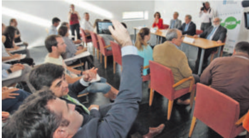
Presentación del proyecto de la aceleradora de empresas el pasado 8 de junio en Expolemos. ROI FERNÁNDEZ

Entre esta primera presentación y mediados de mes, será preciso acondicionar el edificio de Expolemos para esta nueva actividad. El espacio disponible es suficiente, pero hace falta completar equipamientos de los que estas instalaciones carecen después de tres años y medio de cierre, como conexión a Internet y calefacción.