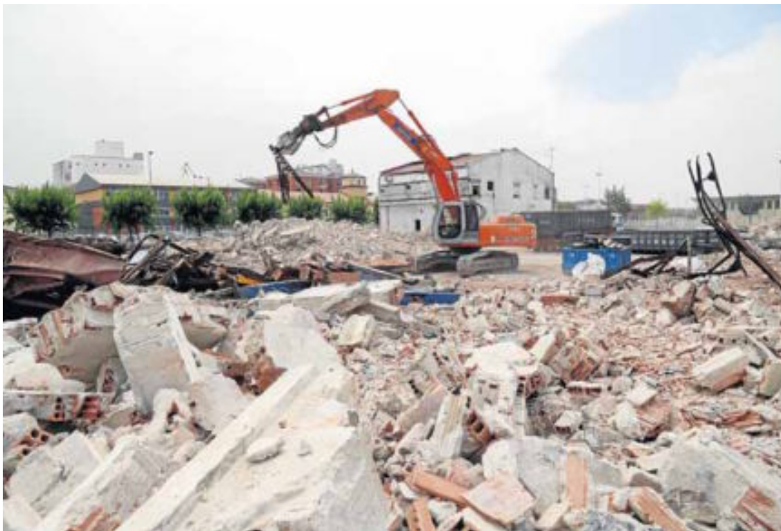
De la viejas naves solo quedan cascotes. :: SANE

En cuanto a las mejoras entre los bloques de vecinos del Pesquero, afectará a las plazas de Los Cabildos y de El Muergo y Entrepatis, correrán a cargo del Ayuntamiento y las obras podrían comenzar este año. Los tres espacios suman una superficie de 3.427 metros cuadrados. El solado y el mobiliario de los espacios a renovar están deteriorados, poseen zonas ajardinadas con algunos árboles y bancos; tienen deficiencias en accesibilidad; la vegetación es inexistente en alguna de las plazoletas y el soleamiento y la protección frente al viento es mejorable. Se renovará mobiliario urbano, iluminación y vegetación.