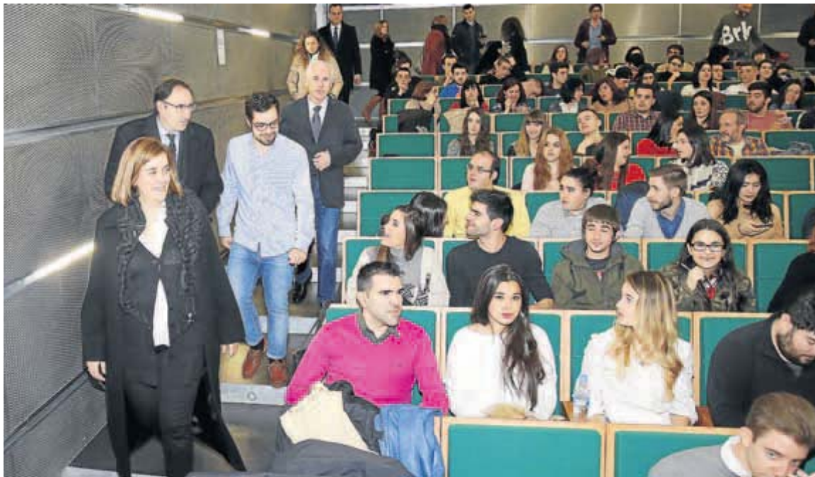
Los representantes institucionales de dirigen a saludar a los estudiantes participantes en la jornada sobre Spinup.