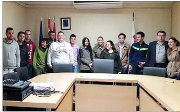
El alcalde con jóvenes del Proyecto Millennials

De este modo, la convocatoria de ayudas aprobada por la Fundación de la EOI y publicada en el BOE del 23 de febrero incluye como condición que los jóvenes a contratar por las empresas que quieran optar a la subvención deben haber participado en esta