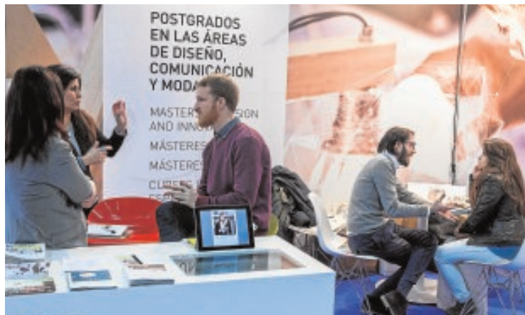
Los centros especializados detallan su oferta a los visitantes

Cuenta con la novedad de «Open Campus», por la que los asistentes conocerán propuestas para impulsar la empleabilidad y el emprendimiento, con orientación sobre las salidas profesionales y los perfiles más demandados. Destacan propuestas como el «Espacio Social + Green», enfocado al emprendimiento ambiental y social, y una especial atención a las competencias digitales. «Taller de desarrollo personal y profesional», «Taller de diseño de modelo de negocio» y «Comunicación digital para start-ups» son algunos de los encuentros organizados para esta nueva modalidad.