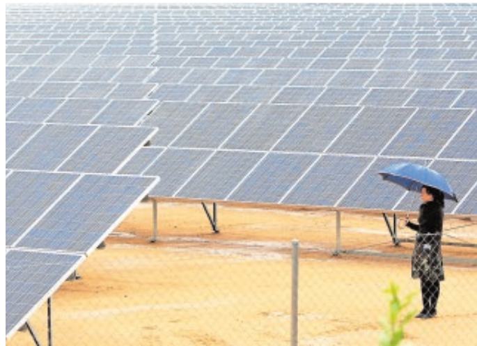
Asegurar el acceso a energías sostenibles es un objetivo de la ONU