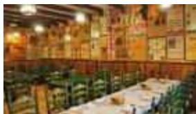
Ruta por los recomendados: Triana