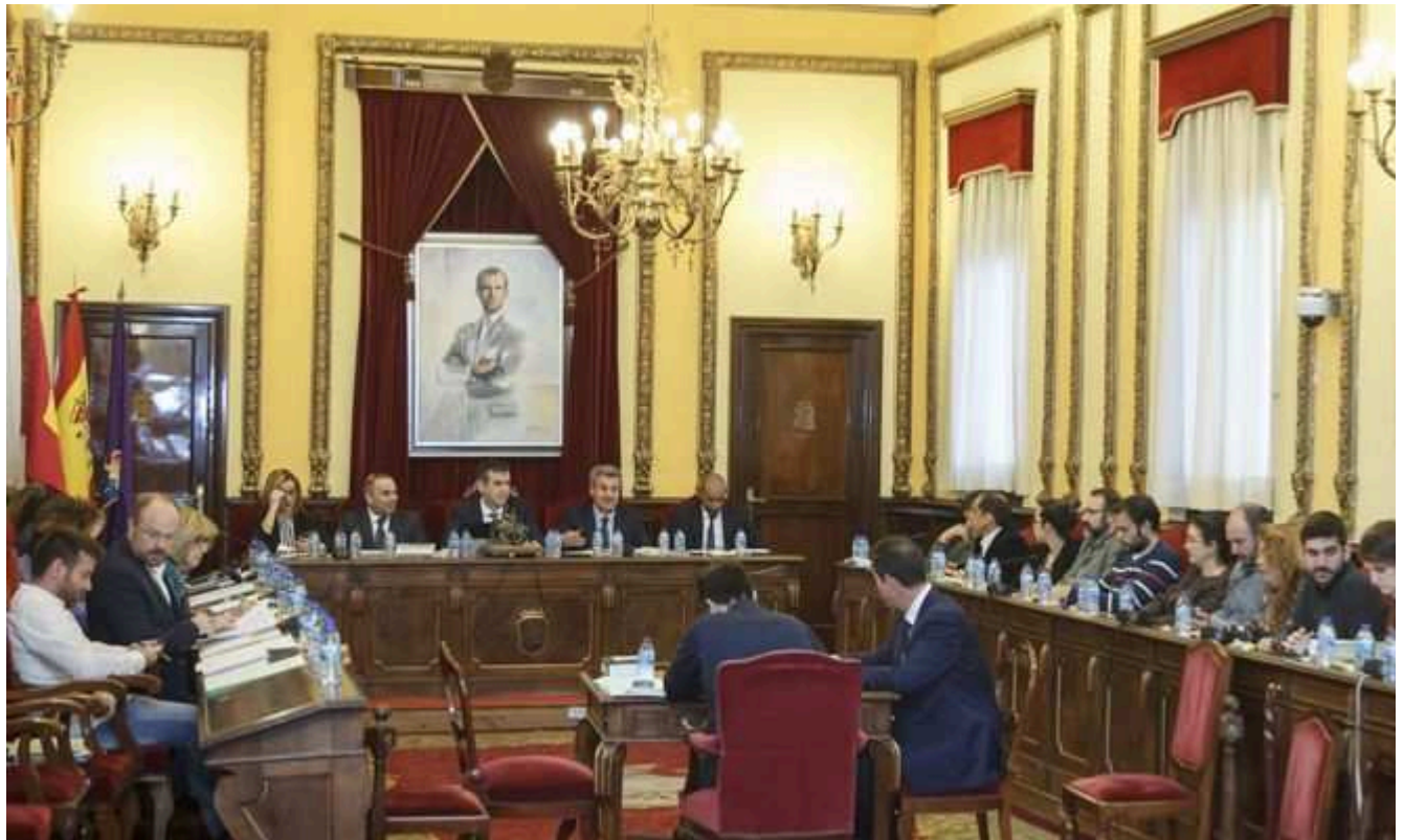
Pleno municipal ordinario. Presupuestos

El pleno del Ayuntamiento de Guadalajara ha aprobado en su sesión de hoy el Presupuesto General del Ayuntamiento y sus Organismos Autónomos para el ejercicio 2018, con los votos a favor del Partido Popular y de Ciudadanos.