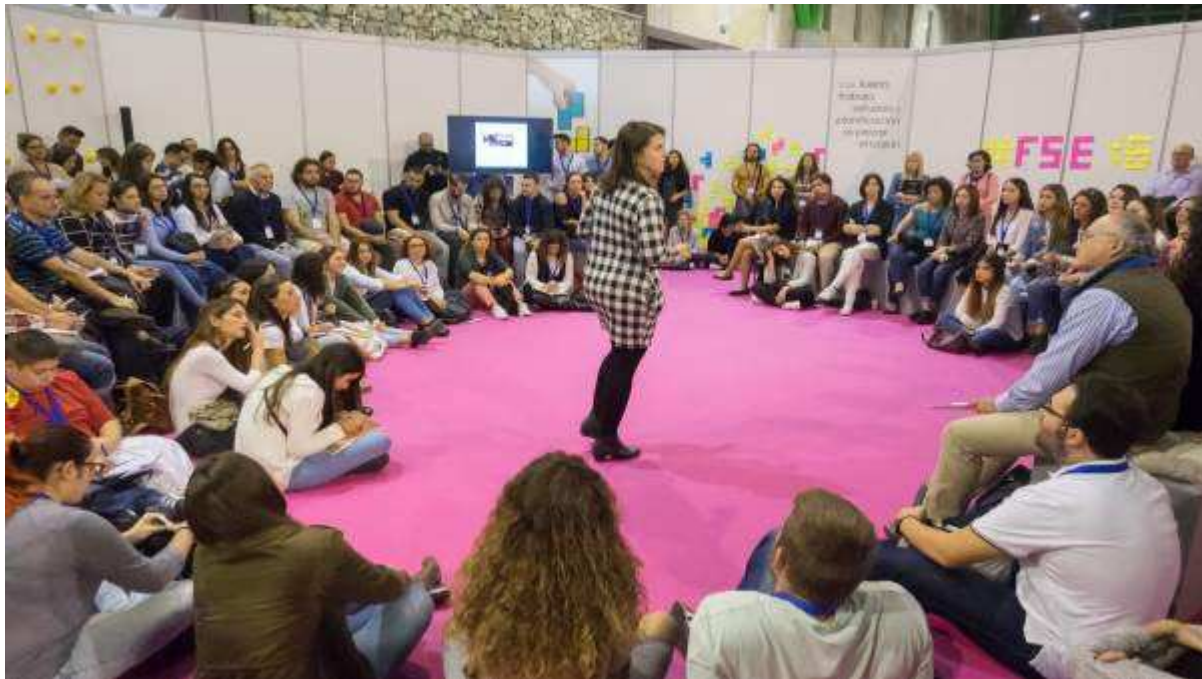
SEr Emprendedor FYCMA

Así, en el transcurso de las mismas y a través de entrevistas abiertas al público, directivos y representantes del mundo empresarial acercarán a los asistentes vivencias y experiencias relacionadas con su trayectoria profesional, siempre desde un punto de vista más personal y cercano.