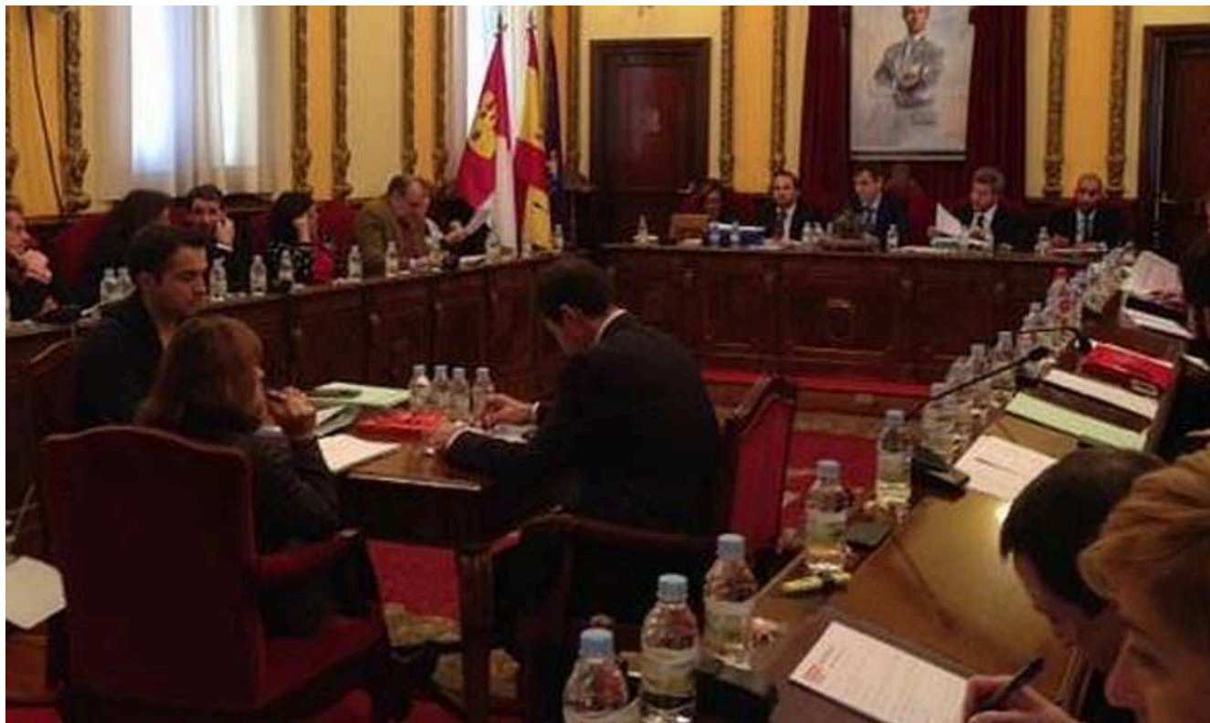
Pleno del Ayuntamiento de Guadalajara

El pleno del Ayuntamiento de Guadalajara ha aprobado este lunes, con los votos a favor del PP y Ciudadanos, el presupuesto del consistorio y sus organismos autónomos para este año, que asciende a a 65,5 millones de euros, que supone el 0,83% más que el de de 2017.