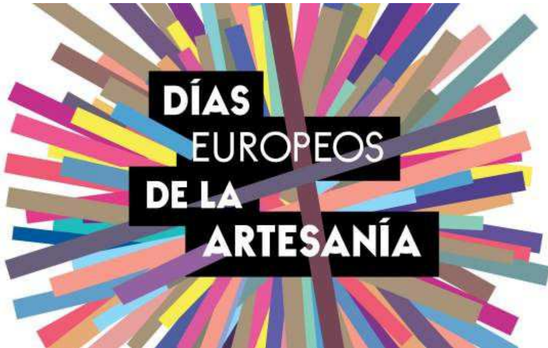
Imagen de los Días Europeos de la Artesanía 2018, que se celebran de forma simultánea en España y otros 17 países del 6 al 8 de abril.