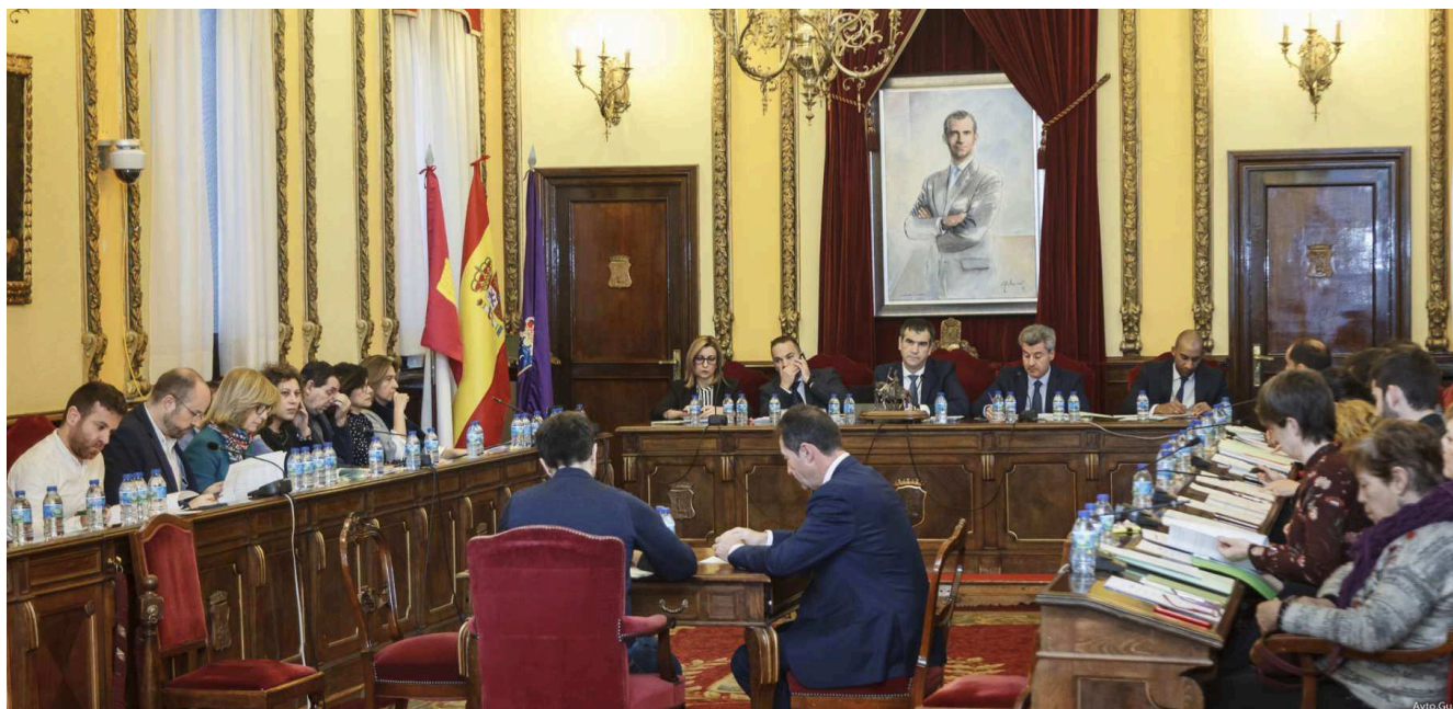
Pleno del Ayuntamiento de Guadalajara