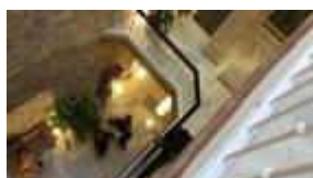
Aperturas, cierres y remodelaciones en Cádiz