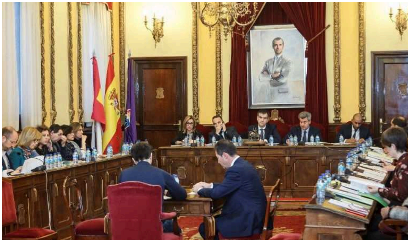
En la imagen un instante del Pleno del Ayuntamiento de Guadalajara que este lunes ha aprobado el presupuesto municipal para este año 2018

El Ayuntamiento de Guadalajara ha sacado adelante el presupuesto para este año, unas cuentas que superan los 65,5 millones de euros y que se han aprobado con el apoyo de los trece votos del equipo de Gobierno del PP y del grupo Ciudadanos y con la oposición de los 12 ediles del PSOE y de Ahora Guadalajara.