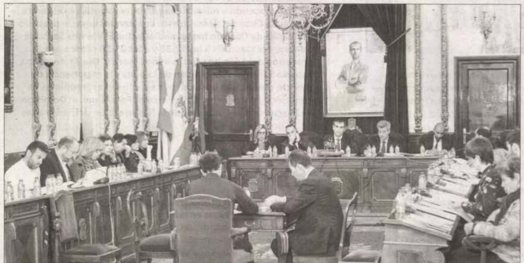
Imagen del pleno municipal celebrado este lunes en Guadalajara.

El Ayuntamiento de Guadalajara destinará a gasto social un 4,3% más que en 2017, concretamente, 4.211.844 euros, cantidad que permitirá seguir implementando programas de asistencia social primaria, como el Plan Concertado, ayuda a domicilio, prestaciones básicas de ayuda de emergencia social, Plan de Integración Social, medidas para el fomento de la igualdad de género, Plan de Apoyo a la Maternidad, a la tercera edad, ayudas para la Cooperación al Desarrollo.... Asimismo, el teniente de alcalde ha anunciado que se mantendrán dentro de una convocatoria única de ayudas de emergencia social las líneas del IBI,