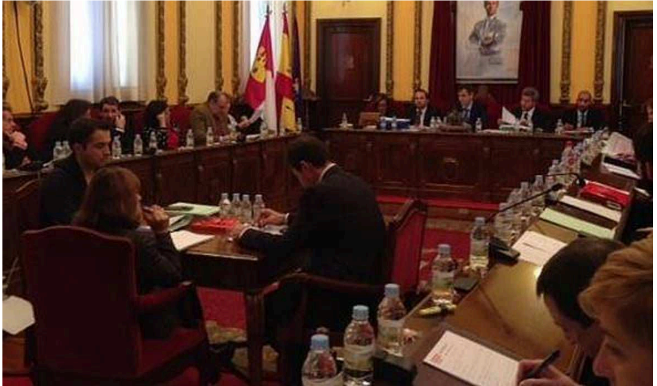
Pleno del Ayuntamiento de Guadalajara