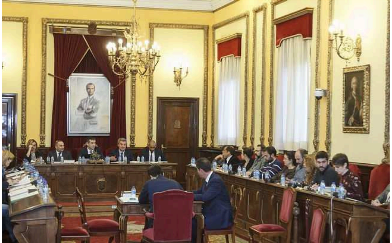
Foto Pleno Guadalajara 26-3-2018