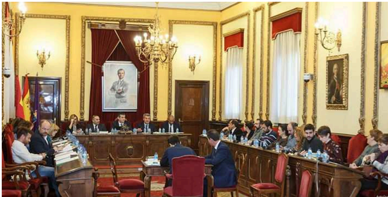
Una imagen del pleno de la capital

El pleno del Ayuntamiento de Guadalajara ha aprobado el Presupuesto General del Ayuntamiento y sus Organismos Autónomos para el ejercicio 2018, con los votos a favor del Partido Popular y de Ciudadanos. El presupuesto del Ayuntamiento de Guadalajara para 2018 asciende a la cantidad de 65.544.215 euros, lo que supone un 0,83% más que en 2017. El presupuesto consolidado del Ayuntamiento y de sus dos organismos autónomos asciende a un total de 67.841.215 euros, un 1,6% más que en 2017.