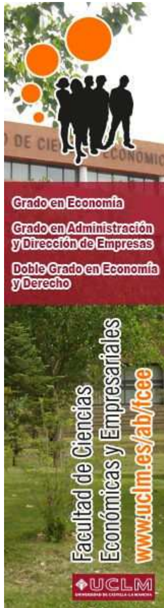
Facultad de Ciencias Económicas y Empresariales

http://es.eprensa.com/cgi-bin/view_digital_media.cgi?subclient_id=4630&comps_id=135501352