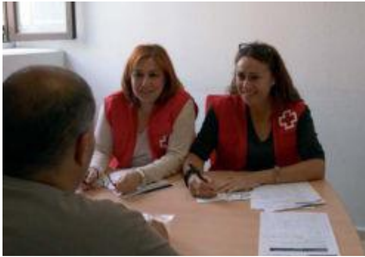
Fundaciones como Cruz Roja Española ofrecerán seguimiento e itinerarios de formación.

Por su parte, la Agencia Estatal de Investigación (INIA), dependiente del Ministerio de Economía, ofrecerá becas de formación de Personal Investigador en centros de I+D agrarios. También El Ministe-