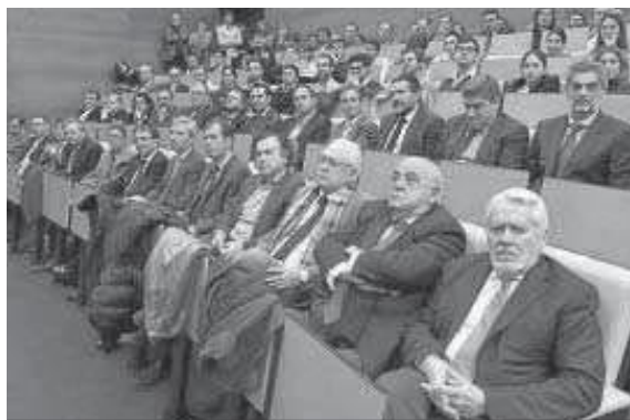
El público asistente al certamen.