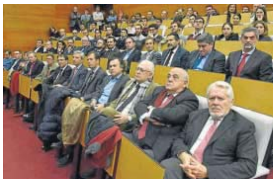
El público asistente al certamen.