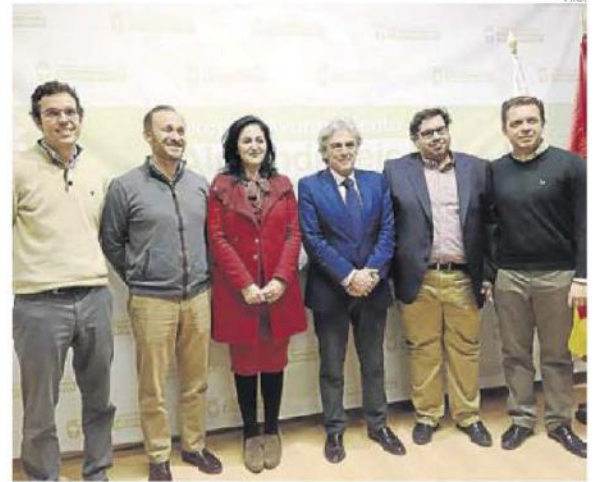
► Representantes del ayuntamiento, EOI y Ceal en la presentación.

La Coordinadora de Empresarios de Almendralejo (Ceal) colabora en el proyecto, pues será la encargada de filtrar la búsqueda de los empresarios que mejor se ajusten al programa. ≡