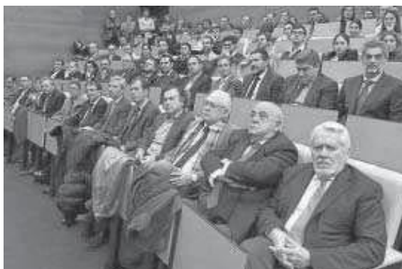
El público asistente al certamen.