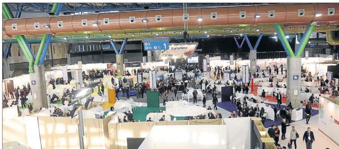
Una vista de la zona expositiva del Foro Transfiere, que durante el miércoles y jueves se ha celebrado en el Palacio de Ferias. ARCINIEGA