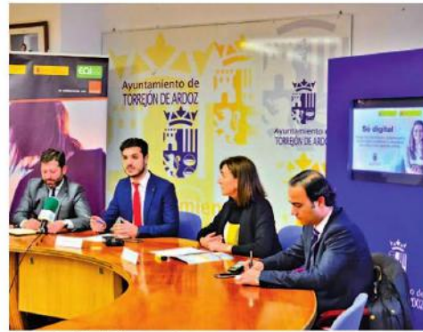
Presentación del proyecto AVTO. DE TORREJÓN DE ARDOZ

Para participar en este proyecto hay que apuntarse en la página web Sedigitalylanzate.com , seleccionar la ciudad de residencia y comenzar a