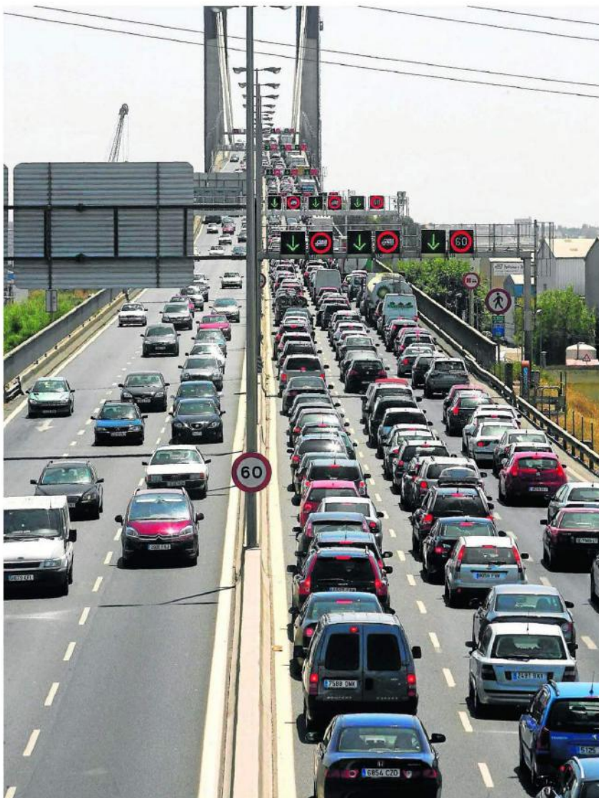
El puente del V Centenario es un punto crítico para la movilidad de la capital hispalense.