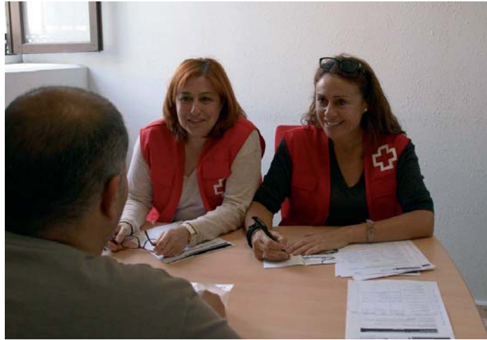
Fundaciones como Cruz Roja Española ofrecerán seguimiento e itinerarios de formación.

Por su parte, la Agencia Estatal de Investigación (INIA), dependiente del Ministerio de Economía, ofrecerá becas de formación de Personal Investigador en centros de I+D agrarios. También El Ministe-