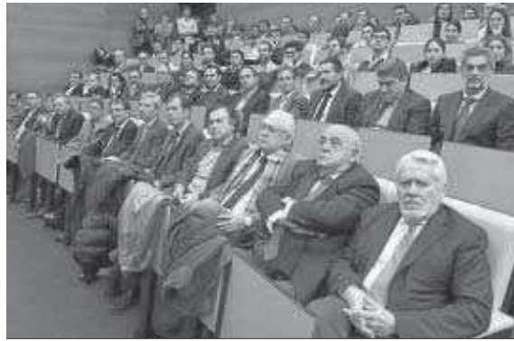
El público asistente al certamen.