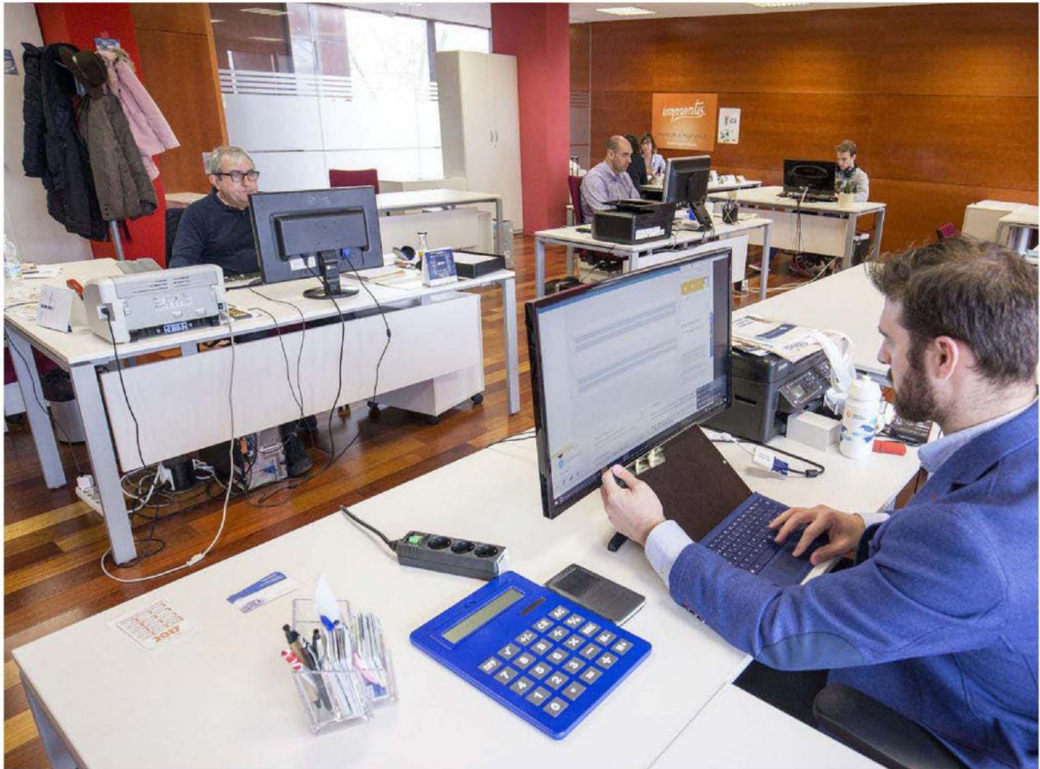
En la actualidad, el CEEI de Guadalajara cuenta con tres salas de 'coworking'. La más grande, en la imagen, cuenta con once puestos de trabajo para emprendedores.