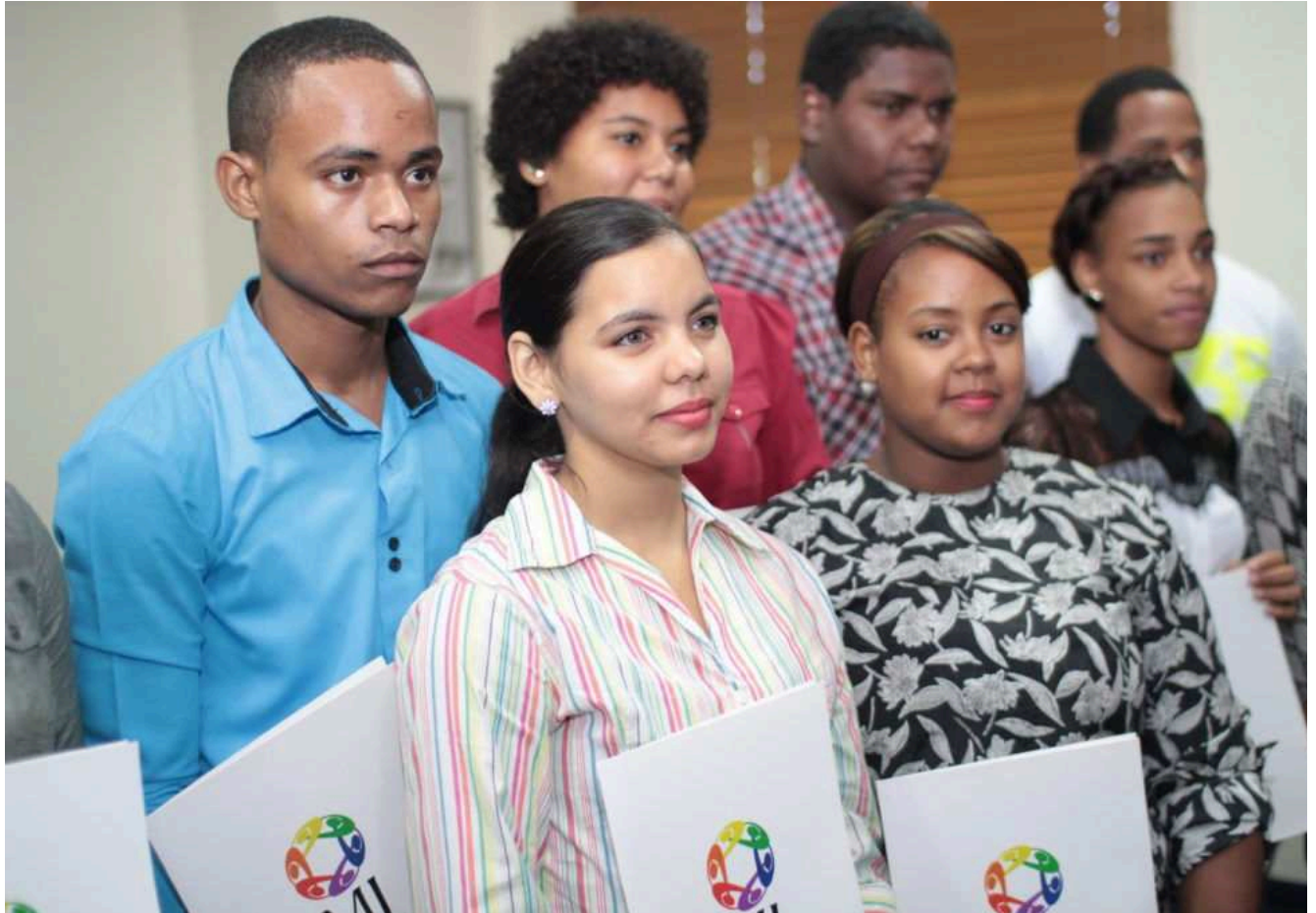
La convocatoria de becas está abierta hasta el 27 de septiembre.

Santo Domingo.- El gobierno anunció la convocatoria nacional Transformación Digital, del programa de becas nacionales e internacionales Agentes del Cambio, del Ministerio de la Juventud, con el cual serán impactados 1000 jóvenes en carreras de grado, postgrado y diplomados en el área de tecnología.