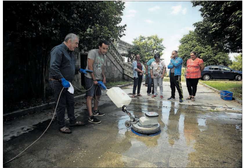
Curso impartido por Cogami en el pazo de Vista Real, en Vilanova de Arousa.

Real, un auténtico vivero de actividad, incluso, durante un mes como el de agosto. La actividad que acoge el centro está orientada tanto a niños como a mayores. Los primeros cuentan con la posibilidad de asistir a clases de inglés totalmente gratuitas, donde existen ya seis grupos diferenciados en función del curso escolar de los alumnos participantes. A estas clases, impartidas en horario matinal por una licenciada en Filología Inglesa, acuden niños de entre 6 y 16 años.