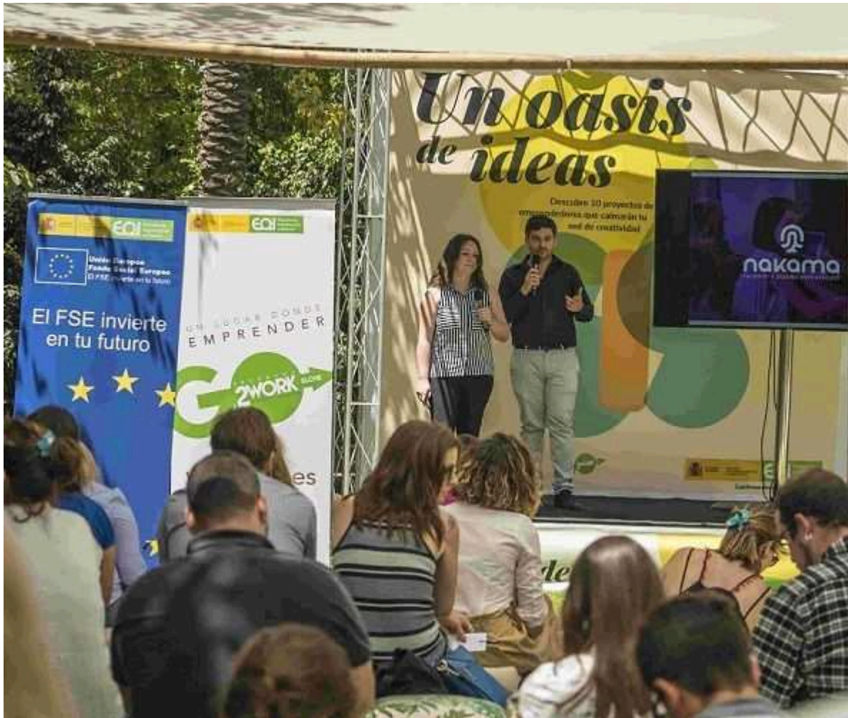
Demo-day Coworking de EOI Mediterráneo en Elche.

https://loblanc.info/nakama-el-nuevo-branding-con-valor-creado-por-dos-emprendedores-de-ibi/