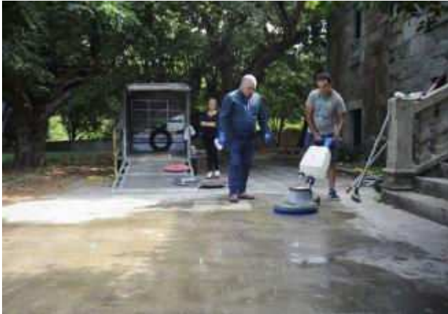
Curso impartido por Cogami en el pazo de Vista Real, en Vilanova de Arousa.

Centro creado para la formación laboral, el pazo de Vista Real en Vilanova se ha convertido en un referente desde la instalación del Centro de Desenvolvemento Local en sus dependencias. Entre esos cursos, Vista Real acoge desde el pasado 30 de julio, un curso de limpieza de superficies en el que participan un total de 15 personas con diferentes grados de discapacidad de municipios de O Salnés. Con una duración de 169 horas, el curso se encuadra en las acciones que realiza la Confederación Galega de Persoas con Minusvalía ( Cogami ).