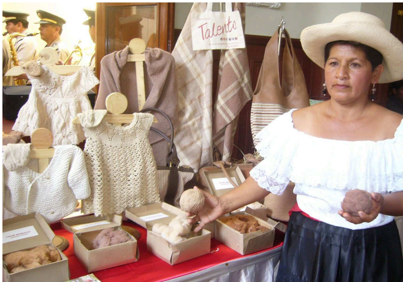
Región Lambayeque celebrará semana de la innovación en artesanía.

Del martes 22 al viernes 24 de agosto Lambayeque será sede de la “Semana de la Innovación en la Artesanía”, certamen organizado por el Ministerio de Comercio Exterior y Turismo (Mincetur) en coordinación con el Centro de Innovación Tecnológica Turístico Artesanal (Cite Sipán) de Lambayeque.