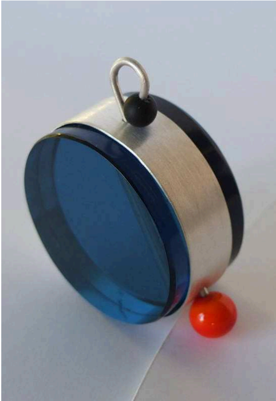
La pieza bautizada como 'Sottsass'. A la derecha, Lombardero.

http://www.diariodeleon.es/noticias/cultura/cuando-vidrio-hace-joya_1269666.html