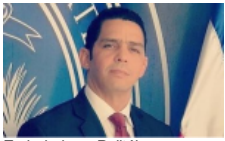
Embajador y Politólogo dominicano dictará conferencia en Miami