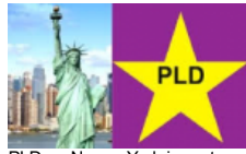
PLD en Nueva York imparte taller de Inmigración a la comunidad dominicana