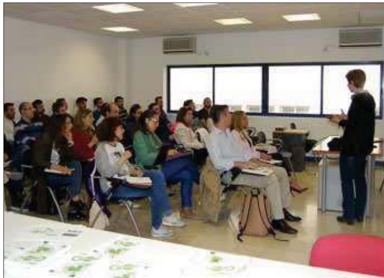
Los emprendedores que han iniciado el proyecto ./ FIRMA

Durante los cinco meses de programa, tanto la mentora residente como numerosos especialistas desarrollarán talleres, jornadas y tutorías individualizadas. El próximo a desarrollar en el marco del programa tendrá lugar el próximo 18 de abril y correrá a cargo de José Manuel Picó Linares, que compartirá con los emprendedores claves en materia de creatividad.