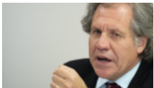
Almagro solicita sesión urgente en la OEA para aplicar la Carta a Venezuela