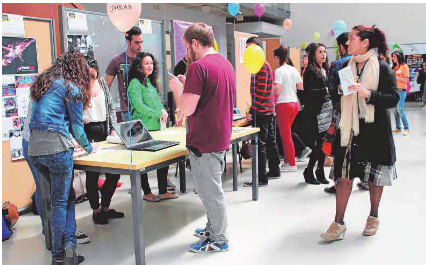
Los emprendedores tienen la posibilidad en la Feria de las Ideas de contactar con posibles inversores para sus proyectos y con el público en general :: IDEAL

A falta de una semana para que se cierren las inscripciones ya han formalizado su solicitud 42 proyectos de diferentes sectores [P02-03]