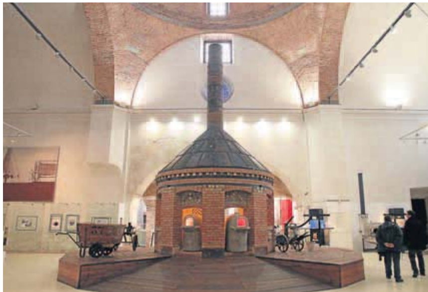
Real Fábrica de Cristales de La Granja uno de los lugares elegidos para hacer uno de los cursos.

«El objetivo de este convenio es reducir el desempleo juvenil aumentando la empleabilidad de los jóvenes mediante cursos formativos intensos, prácticos y adaptados a las necesidades de las empresas», expuso el presidente de la Corporación segoviana, Francisco Vázquez. Además, el acuerdo también establece el fomento de la contratación a través de ayudas dirigidas a las empresas dispuestas a la generación de