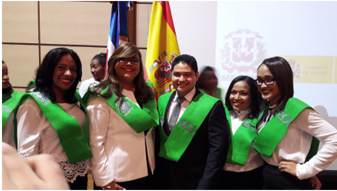
Clausura alumnas MESCYT

Madrid, España.-La Escuela de Organización Industrial (EOI), en colaboración con el Ministerio de Educación Superior, Ciencia y Tecnología de República Dominicana (MESCYT), convoca 300 becas de exención de matrícula dirigidas a profesionales dominicanos para cursar programas máster. Especializados en distintas materias, estos están orientados al desarrollo nacional y a la competitividad de los sectores productivos y de servicios de República Dominicana.