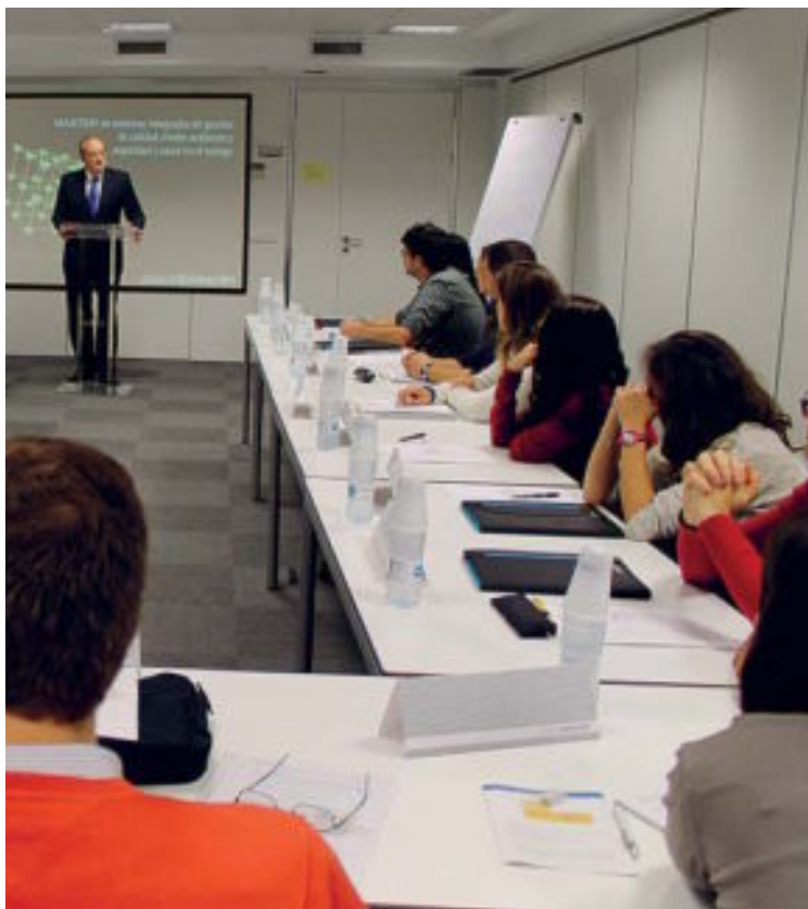
Aula del centro AENOR de Formación.