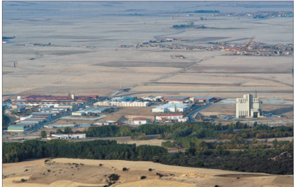
Vista del polígono industrial de Valverde del Majano, en una imagen de archivo. / JUAN MARTÍN