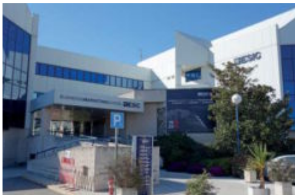
Uno de los edificios del ESIC.

C/ Arroyofresno, 1 28035 (Madrid) Tel.: 913 862 511