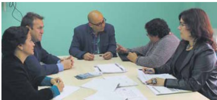
REUNIÓN de la Mesa de Calidad de la Mancomunidad del Levante Almeriense. LA VOZ

Objetivos El objetivo de esta Mesa de Calidad es el de aprobar los informes para el comité de Distinción, siguiente paso para que se conceda la perseguida revali-