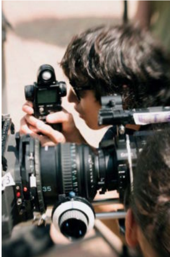
Alumnos de ECAM.

Técnico Sup. en Caracterización y Maquillaje Profesional