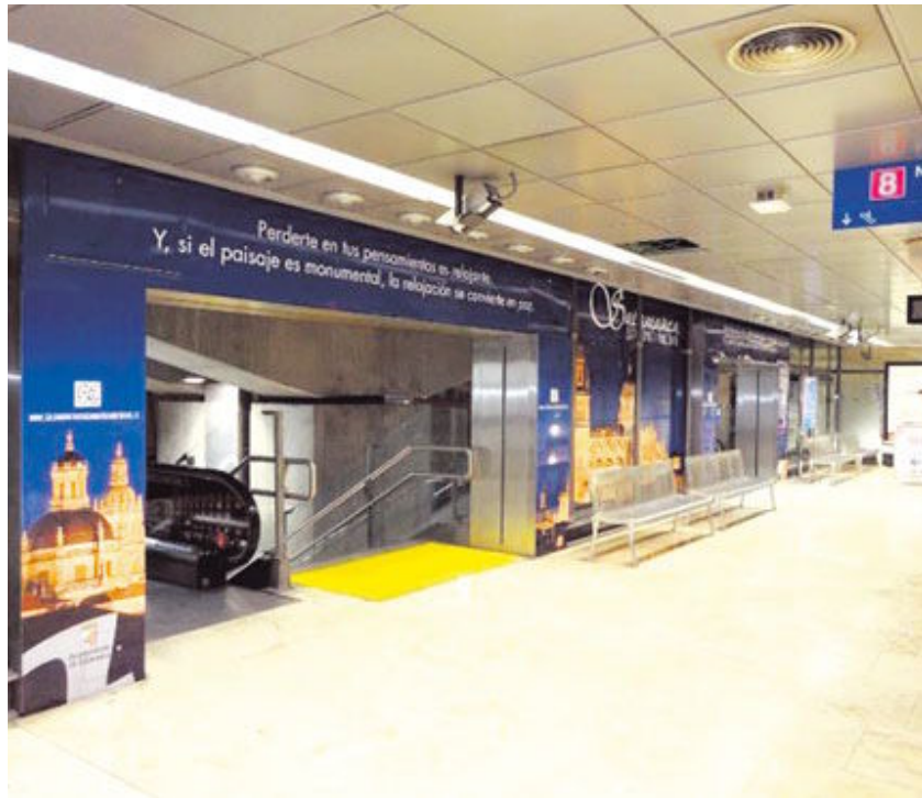
Carteles de promoción de la última campaña en una estación de metro de Madrid.

Por otra parte y después de que el anterior concurso de adjudicación quedase desierto, la sociedad municipal volverá a licitar la mejora de la información y los contenidos del Museo Taurino. Lo hará con un presupuesto de 50.000 euros, 10.000 más que en su primer intento, e incluyendo entre las actuaciones a ejecutar mejoras en materia de accesibilidad.