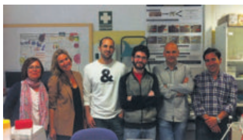
EL EQUIPO que hace posible esta innovadora empresa.

Life Bioencapsulation es una 'spin-off' de la Universidad de Almería cuyo objetivo es la transferencia de resultados de investigación a la industria agroalimentaria, sobre todo, en materia de acuicultura.