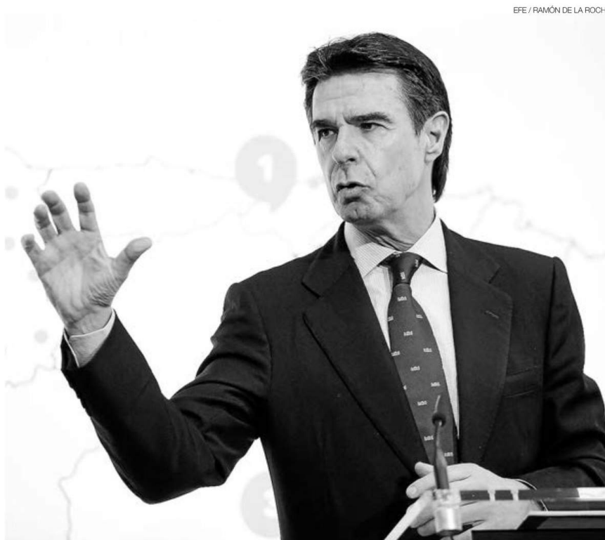
▶▶ José Manuel Soria durante un acto en la Escuela de Organización Industrial, ayer en Tenerife.

Ya al conocerse la noticia el ministro se apresuró a negar "tanjuntamente" y ante varios medios tener algo que ver con esta sociedad, apuntando que se trataba de una compañía consignataria con la que había trabajado