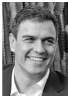
Pedro Sánchez Secretario general del PSOE

En la misma línea se pronunció la secretaria general del PP, Dolores de Cospedal, que destacó ayer que José Manuel Soria ha realizado un "desmentido rotundo y tajante, y en ese desmentido tajante tiene el apoyo de su partido y también en acudir a las instancias judiciales y jurídicas para demostrar su inocencia", sostuvo. Por su parte, el ministro de Asuntos Exteriores, José Manuel García Margallo, aseguró que no tiene "la menor razón para dudar en absoluto" de la palabra del titular de Industria.