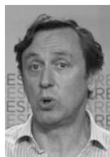
Rafael Hernando Portavoz del PP en el Congreso

El líder de Ciudadanos recordó ayer que fue Mariano Rajoy quien nombró ministro a José Manuel Soria y, por tanto, a su entender es quien debe aclarar si lo va a mantener en el Gobierno tras el caso de los Papeles de Panamá y también si "defiende" lo que ha manifestado el ministro. Rivera explicó que buscará el respaldo de otros grupos para cumplir el reglamento.