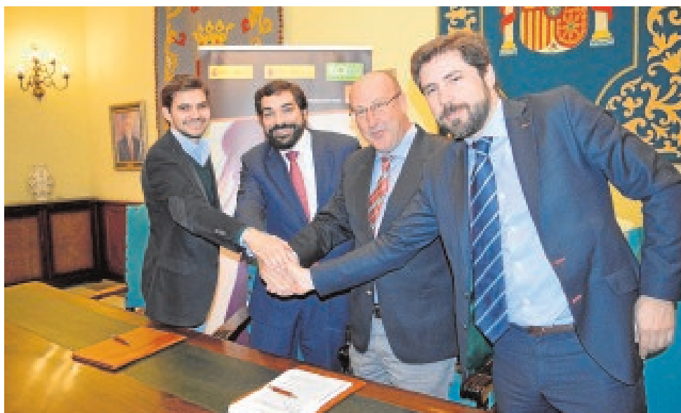
La firma del convenio entre el Ayuntamiento, Orange y el EOI