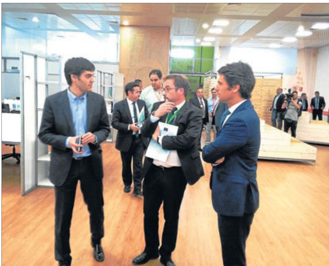
Pabellón B. El consejero de Desarrollo Económico del Cabildo, Raúl García (centro), en el espacio de 'coworking'.

Raúl García, consejero de Desarrollo Económico del Cabildo, destacó la apuesta de ambos programas por «facilitar el primer empleo» a jóvenes nini.