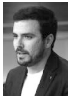
Alberto Garzón Líder de Izquierda Unida

El líder del PSOE echó mano ayer de su cuenta en Twitter para exigir la dimisión de José Manuel Soria: "El ejemplo a seguir es el del primer ministro islandés Sigmundur David Gunnlaugsson". Sánchez exige a Soria que asuma su responsabilidad tras conocerse que era uno de los administradores, junto con su hermano, de una sociedad en el despacho Mossack Fonseca.