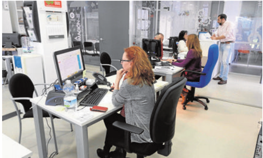
Edificio empresarial del Urban que acogerá el centro de emprendedores.

Los proyectos seleccionados tendrán cinco meses de oficina y asesoramiento de expertos gratuito para posteriormente independizarse. A la hora de elegir los candidatos, explica el profesor, el requisito fundamental es que tengan un proyecto empresarial avanzado y, sobre todo, haya estudiado su viabilidad. «Muchas veces los proyectos fracasan porque los emprendedores no estudian con detenimiento la viabilidad. Aquí cuentan con técnicos que les ayudarán a discernir más claramente antes de la inversión». Por experiencia en experiencias de este tipo, explica en EOI, el 90% de los seleccionados tiene después una larga