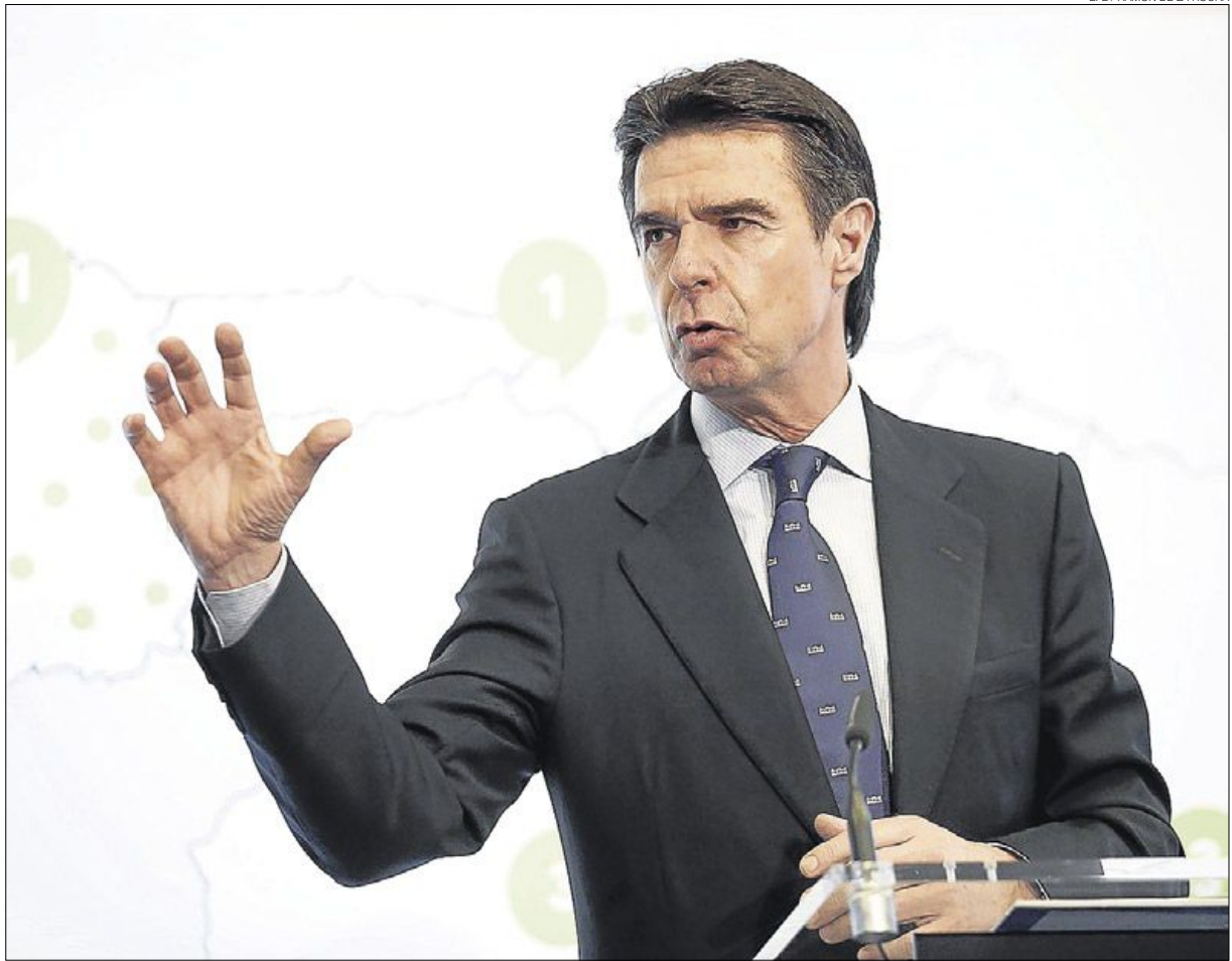
►► José Manuel Soria durante un acto en la Escuela de Organización Industrial, ayer, en Tenerife.

DECLARACIÓN // El titular de Industria reconoció ayer que tuvo relación con UK lines, pero «exclusivamente comercial». Aseveró que nunca ha sido socio, directivo o administrativo de esa empresa, de la que tampoco ha tenido acciones: «Desmiento rotundamente que haya prestado servicio a ninguna compañía que no sea española. Las noticias que me relacionan con Panamá no tienen fundamento», insistió Soria desde Lanzarote. Ya al conocerse la noticia el ministro se apresuró a negar «tajantemente» y ante varios medios tener algo que ver con esta sociedad, apuntando que se trataba de una compañía consignataria con la que había trabajado su empresa familiar. Y avanzó que, a petición propia, pediría a la justicia que, a través de una comisión rogatoria, solicitase que Panamá certifique si es cierto o no que su nombre figura en los polémicos papeles o cualquier otra empre-