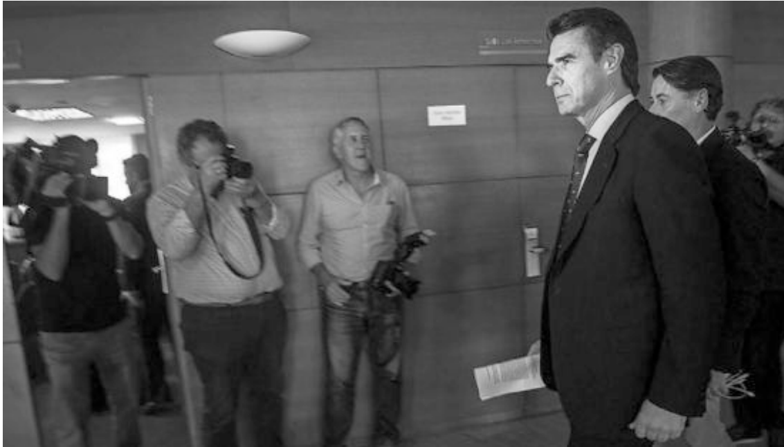
El ministro José Manuel Soria ayer antes de comparecer ante los medios en el Arrecife Gran Hotel, en Lanzarote.

del Gobierno en funciones, Mariano Rajoy, explique en el Congreso si defiende al ministro de Industria, José Manuel Soria, tras aparecer en los Papeles de Panamá . Rivera consideró que sería "mejor para todos" que el jefe del Gobierno en funciones acudiera voluntariamente al pleno del Congreso para aclarar este asunto.