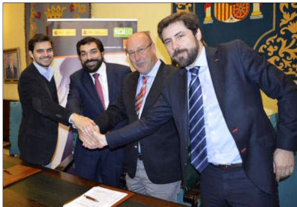
Momento de la firma de ‘Sé Digital’ en el Ayuntamiento.

cia de adaptar los negocios a las nuevas tecnologías, «que son herramientas muy eficaces para mejorar la posición en el mercado», por eso animó a empresarios y a emprendedores a participar en este programa en el que cola-