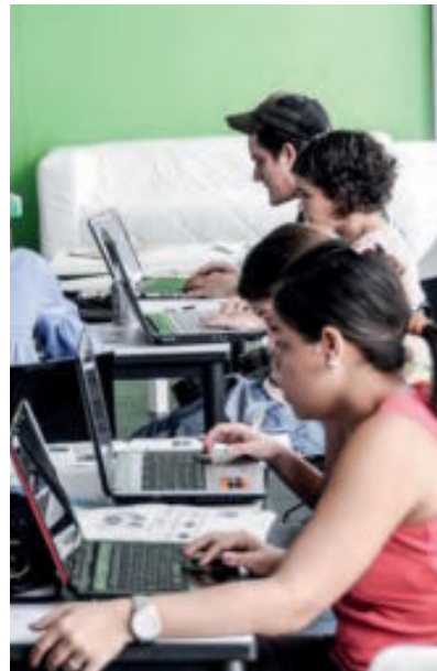
Es difícil predecir los cambios. Hace unos años disciplinas como el Big Data o el 'Internet de las cosas' eran pura ciencia ficción.

El nuevo perfil directivo vendrá definido por el talento para liderar la transformación digital en las organizaciones. También por su capacidad de adaptación permanente no ya al cambio, que eso siempre ha existido, sino a vivir en la incertidumbre que el cambio tecnológico genera. Esa disposición conlleva una actitud resolutiva para tomar decisiones ágiles y valentía para correr riesgos. Y, por supuesto, se definirá por una marcada sensibilidad social y medioambiental.