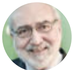
FERNANDO BAYÓN DIRECTOR GENERAL DE EOI