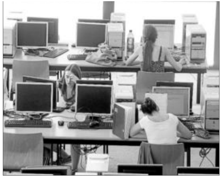
La UJI es responsable de la formación.