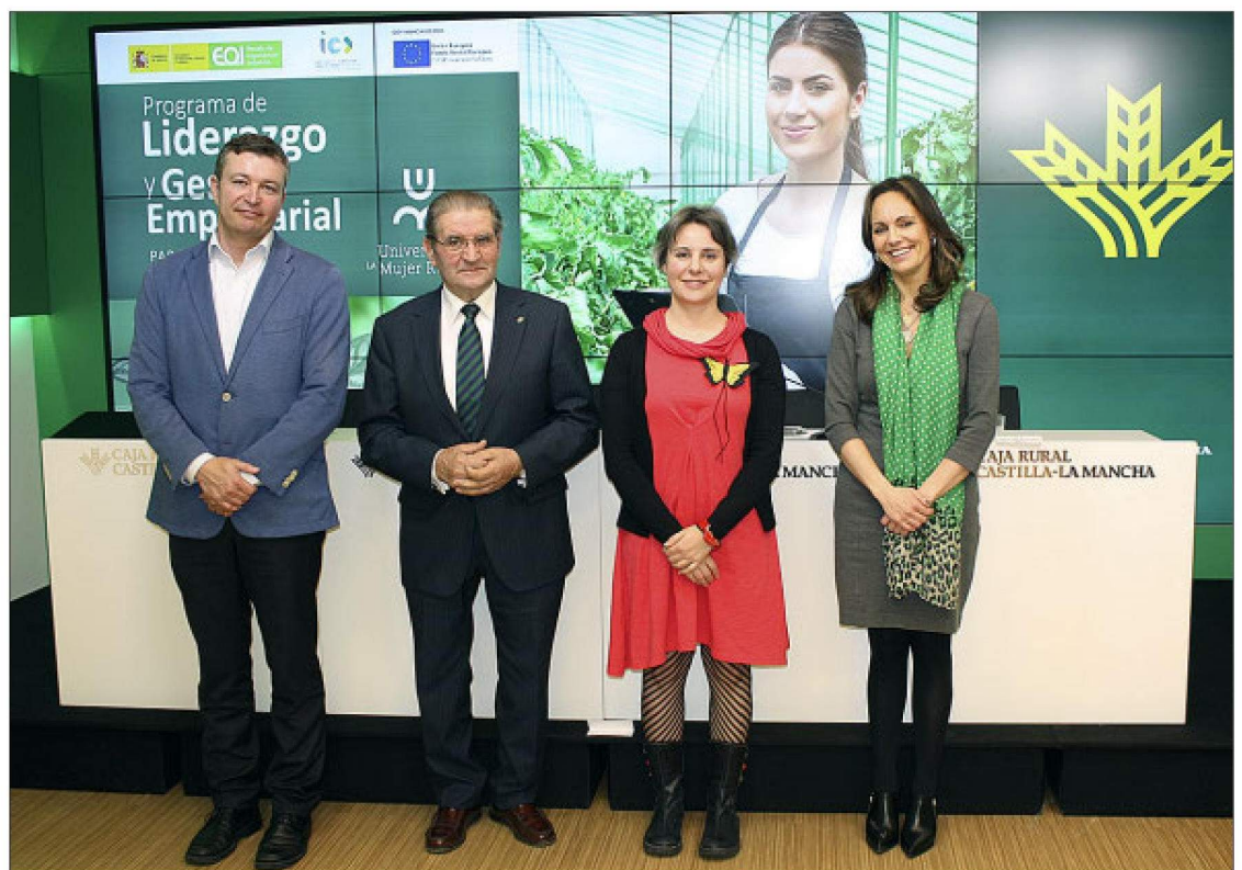
Representantes de la Escuela de Organización Industrial, Caja Rural y el Instituto de la Mujer presentaron ayer el programa.

tirán en horario de mañana y están cofinanciados por el Fondo Social Europeo. Se desarrollarán desde mayo hasta octubre.